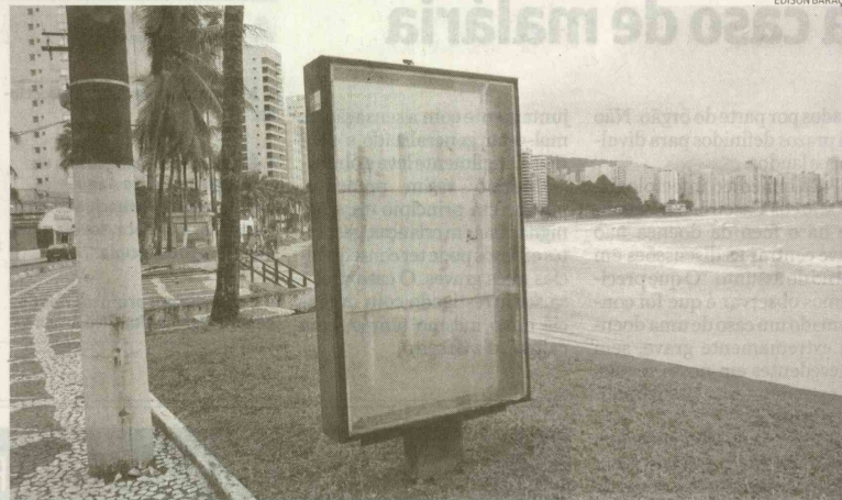
Os espaços publicitários ficam nas praias de Astúrias, Enseada, Pitangueiras e do Tombo, em Guarujá

Além disso, a Prefeitura afirma que os equipamentos, apesar de estarem instalados em área da União, pertencem à