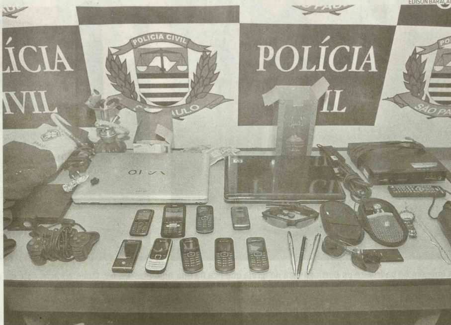
Parte dos objetos roubados da residência do casal em Guarujá foi recuperada em poder dos marginais