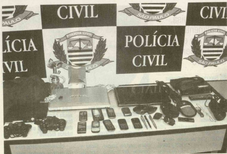
Os objetos roubados estavam em barracos no Morro do Macaco Molhado